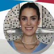
Guadalupe Cevallos Cocina