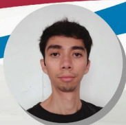
Abraham Carvajal Pintura